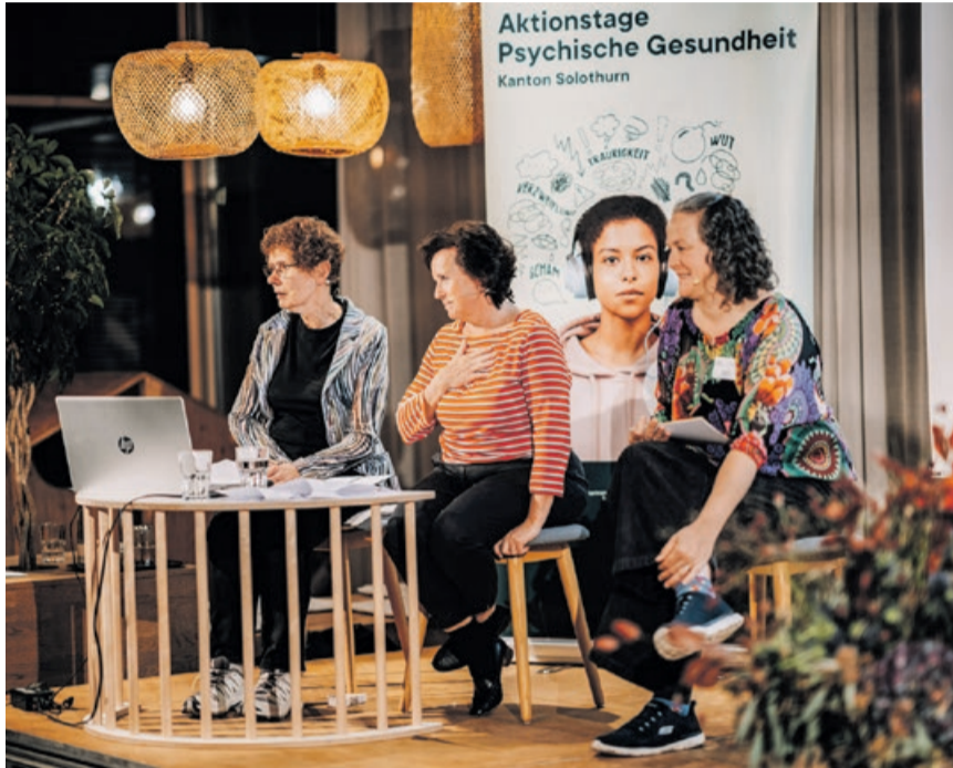
Die Aktionstage bieten auf vielfältige Art und Weise Gelegenheit zum Austausch.

Spitzensport, ADHS, Perfektionismus Den Auftakt der diesjährigen Aktionstage Psychische Gesundheit wird am 5.