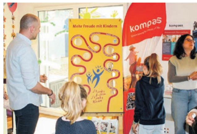
Am Tag der offenen Tür in der Kita easy-kid-care wurden diverse Beratungsangebote rund um das Eltern- und Kindsein vorgestellt.

menpraxis vor und nach der Niederkunft werdenden und frischgebackenen Eltern zur Seite, sieben Tage die Woche.