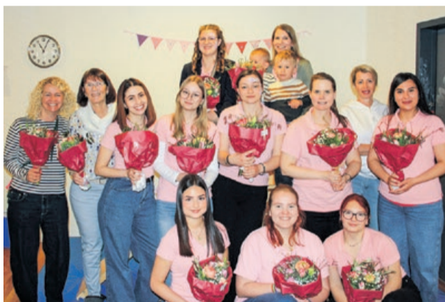
Das Team von easy-kid-care in Egerkingen mit Kundinnen der ersten Stunde.

Seit 1994 erbringt die Fachstelle kompass im Kanton Solothurn vielfältige Dienstleistungen zur Unterstützung von Eltern, Kindern und Jugendlichen in unterschiedlichen Lebenssituationen. Ihr Angebot gliedert sich in Elternbildung und Beratung, sozialpädagogische Familienbegleitung und die Unterstützung von Pflegefamilien. Das Elternsein lernen kann man im mehrteiligen Kurs «Eltern werden – Eltern sein», den kompass auch dieses Jahr wieder im Programm hat. Beim Zentrum Bauchgefühl in Oensingen stehen Schwangerschaft, Geburt und Wochenbett und die damit verbundenen Veränderungen im Fokus. Geburtsvorbereitung, Wochenbettbetreuung, Stillberatung und weiteren unterstützenden Angeboten und Kursen steht die Hebammen-