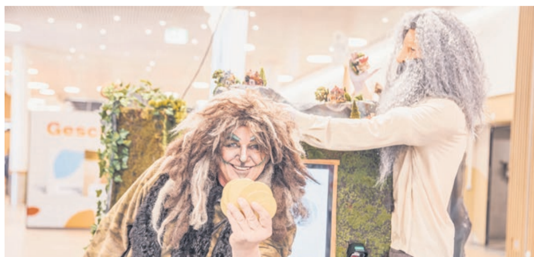
Tauche ein in eine Welt voller Mythen und Sagen.

Erlebe im Perry Center eine sagenhafte Zeit voller Spiel, Spannung und unvergesslicher Momente – ein Abenteuer für die ganze Familie. Wir freuen uns auf deinen Besuch!